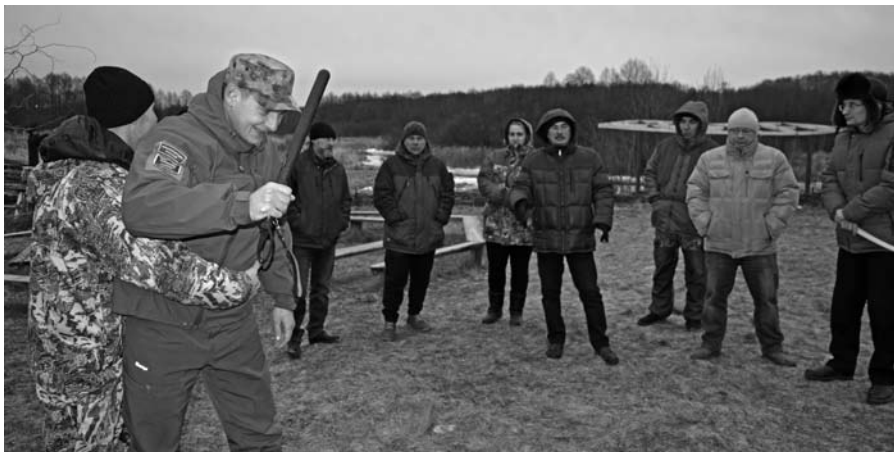
Тактика задержания нарушителей

В случае чрезвычайной ситуации госинспектору могут потребоваться навыки оказания первой помощи, например, пострадавшим от переохлаждения, вне-