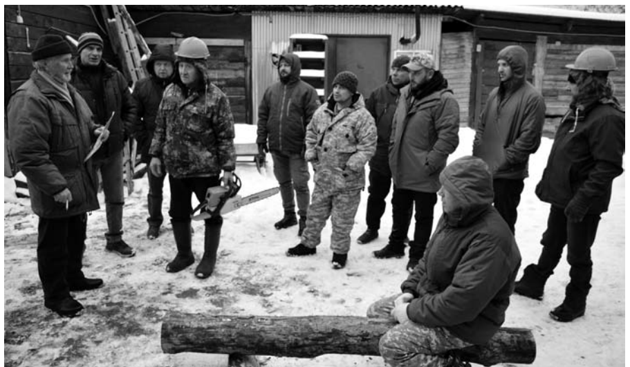
Зачет по программе «Вальщик леса»

Разобрались с приемами самообороны и тактикой задержания нарушителей участники семинара на мастер-классе от вице-президента Федерации