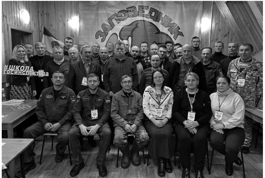
Участники семинара-тренинга «Школа госинспектора»

Охрана территории от посягательства браконьеров – одна из основных задач государственных инспекторов. Здесь